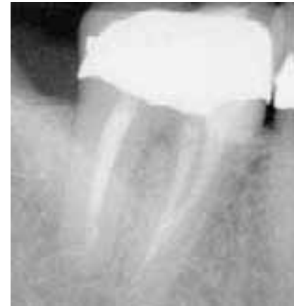
Abb. 4c: Postoperative Röntgenkontrolle

Vergrößerungshilfen kann bei obliteriertem Pulpenkavum bzw. bei obliterierten Kanaleingängen als zwingende Voraussetzung erachtet werden. Vor allem bei überkronen Zähnen sind die Sichtverhältnisse unzureichend. Falls eine Lupenbrille mit Beleuchtung oder ein dentales Operationsmikroskop nicht zur Verfügung steht, kann eine starke Lichtquelle, z. B. eine Polymerisationslampe, unter dem Kofferdam an das koronale Wurzelkavum gehalten werden. Dadurch können die Sichtverhältnisse beim Blick in die Zugangskavität deutlich verbessert werden.