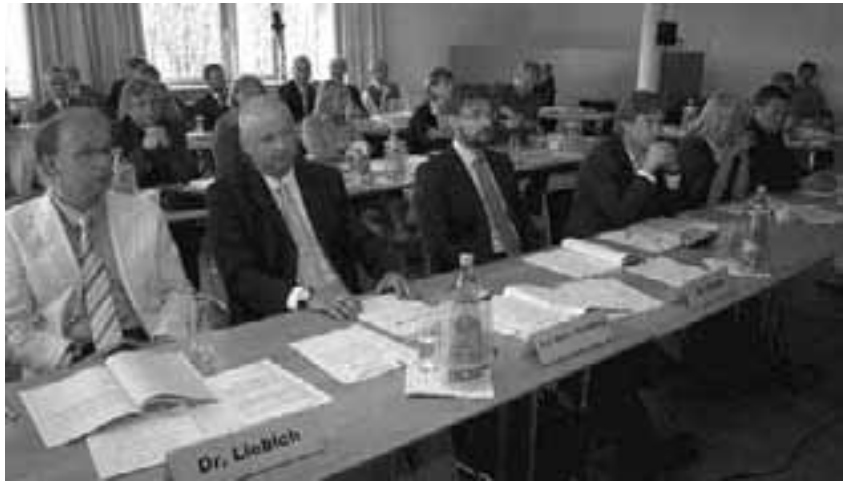
Nachdenkliche Gesichter in der Versammlung. Es standen knifflige Fragen auf der Tagesordnung.

Wenn Abeln davon spricht, dass sich in absehbarer Zeit entscheiden wird, wie es mit der gesetzlichen Krankenversicherung zukünftig weitergehen wird, sieht er nicht ausschließlich die zahnärztliche Selbstverwaltung in der Pflicht, politische Vorgaben umzusetzen. „Wir haben auch Rechte und diese müssen wir innerhalb eingeräumter Spielräume nutzen, um gemeinsame Ziele zu erreichen“, führte er an. Dafür ist es wichtig, eine geeinte Zahnärzteschaft zu haben. „Das haben wir jetzt. Wodurch? Durch die Zwangsmitgliedschaft in der Körperschaft“, sagte Abeln. Hier wird es Veränderungen geben. Der Wettbewerb unter den Zahnärzten nimmt zu, aber auch der Wettbewerb zwischen gesetzlicher und privater Krankenversicherung. Krankenkassen verändern den Aufgabenumfang ihrer Landesvertretungen, bieten Selektivverträge an und können damit den Sicherstellungsauftrag in diesem