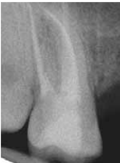
Abb. 3c: In der mesioexzentrischen Röntgenaufnahme wird diese „Entschärfung“ deutlich sichtbar..