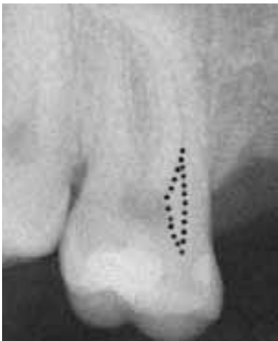
Abb. 3a: „Entschärfung“, koronal der Krümmung werden die der Furkation abgewandten Dentinüberhänge entfernt. Somit wird die Krümmung „entschärft“.

Eine intrapulpa Injektion ist nach nicht ausreichender Anästhesietiefe nach Leitungs- oder Infiltrationsanästhesie meistens sehr hilfreich. Nach kleinflächiger Eröffnung des Pulpadaches wird die Injektionsnadel so tief wie möglich in das Kavum vorgeschoben. Dieser Vorgang ist in der Regel für den Patienten kurzzeitig schmerzhaft. In den meisten Fällen tritt eine sofortige Reduktion oder eine vollständige Ausschaltung der Schmerzen ein. Ein spürbarer Widerstand ist bei der Injektion entscheidend, weswegen die Öffnung im Bereich des Pulpadaches nicht so groß sein darf, dass das Anästhetikum nur nach koronal abfließt und den Druckaufbau im Pulpakavum verhindert. Nach Ausräumen des Kronenpulpakavums können weitere Injektionen direkt in die Wurzelkanäle notwendig werden. Dafür wird der Kanal bis kurz vor den Schmerzpunkt erweitert (z. B. mit Gates-Glidden-Bohrern) und die Injektionsnadel erneut so tief wie möglich eingeführt. Nur in wenigen Fällen muss dieses Vorgehen mehrfach wiederholt werden, um den gesamten Kanal schmerzfrei instrumentieren zu können.