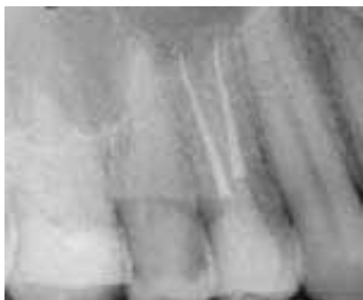
Abb. 5: Überfüllung: Leichtes Überpressen von Sealer oder erwärmter Guttapercha bei exakt eingehaltener Arbeitslänge wird als „Überfüllung“ definiert.

Im Gegensatz zum koronalen Kanalabschnitt sind die Sichtverhältnisse sehr viel schlechter. Oft ist eine Visualisierung des apikalen Abschnitts aufgrund von Kanalkrümmungen auch mit dem dentalen Operationsmikroskop unmöglich. Ein kraftvolles Vordringen geht in diesen Fällen immer mit einem hohen Perforationsrisiko einher.