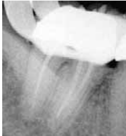
Abb. 4b: Situation nach Entfernung des frakturierten Instruments mittels Ultraschall bei der Masterpointkontrolle.