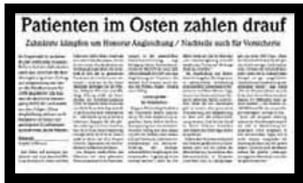
Auszug aus der Schweriner Volkszeitung vom 4. Mai.

Die Begründung aus Berlin, dass die Ausgaben für die gesamte zahnärztliche Behandlung einschließlich Zahnersatz je Versicherter auf West-Niveau liege, beruht laut Abeln auf einem Vergleich zwischen Äpfeln und Birnen. Denn für den Zahnersatz gibt es bereits eine gesonderte Finanzierung und Angleichung, so dass sich die Gesamtrechnung verzerrt. Das hat der Bund in einem früheren Schreiben vom Dezember 2008 sogar selbst eingeräumt.