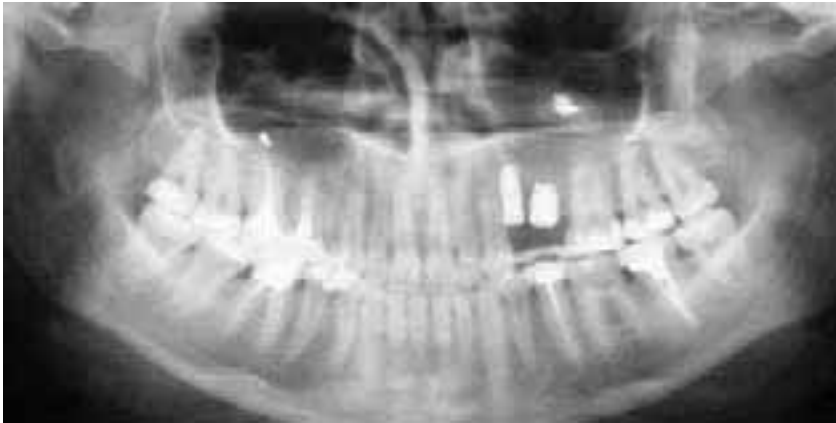
Abb. 6a: Füllmaterial. Im Orthopantomogramm vor den Revisionsbehandlungen imponiert überpressstes Wurzelfüllmaterial in beiden Kieferhöhlen.