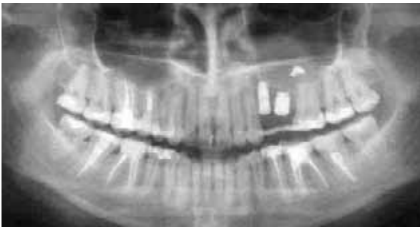
Abb. 6b: Nach Abschluss der Revisionsbehandlungen fällt auf, dass das Füllmaterial die rechte Kieferhöhle vermutlich über die Nase verlassen hat. Das ist allerdings als absolute Ausnahme anzusehen. Das Wurzelfüllmaterial in der linken Kieferhöhle wurde chirurgisch entfernt.

wenn die apikal des Fragments gelegenen Kanalanteile fachgerecht chemomechanisch aufbereitet werden können.