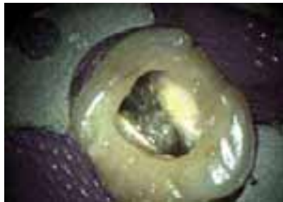
Abb. 1b: Diffuse Kalzifikation. Nach Darstellung des palatinalen, mesio- und distobukkalen Kanaleingangs und Entfernung des Wurzelkanalfüllmaterials imponiert eine diffuse Kalzifikation am Pulpaboden und Reizdentin mesial.

Anästhesietiefe erachtet. Die Taubheit der Lippe ist als Kriterium jedoch unzureichend. Die Behandlung sollte nicht begonnen werden, so lange die Schmerzsymptomatik noch mit anderen Mitteln provozierbar ist.