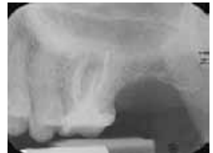
Abb. 1d: Postoperative Röntgenkontrolle am Pulpaboden und Reizdentin mesial.