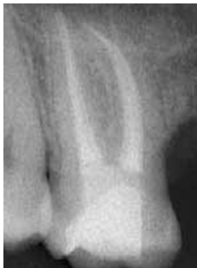
...ebenso in der distoexzentrischen Aufnahme (Abb. 3d)