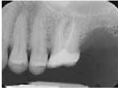
Abb. 1a: Ausgangsröntgenaufnahme vor Revision des Zahmes 26

Die Behandlung sollte erst bei einer ausreichenden Anästhesietiefe begonnen werden. D.h. es sollten keine Spontan- oder Perkussionsschmerzen vorliegen. Zudem sollte keine Temperaturempfindlichkeit bei Anwendung von Winkelstückkühlung oder Luftbläser mehr zu beobachten sein. Häufig wird bei der Leitungsanästhesie des N. alveolaris inferior die Taubheit der Lippe als ausreichende