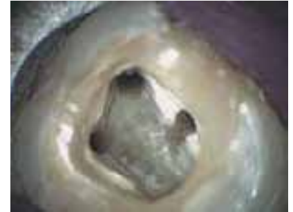
Abb. 1c: Zugangskavität nach Entfernung des kalzifizierten Gewebes und Darstellung des zweiten mesiobukkalen Kanals unter dem in Abb. 1b weiß bis gelblich erscheinenden Reizdentin.

Wenn trotz ausreichender Wartezeit und Erhöhung der Dosis von einer auf zwei Ampullen keine ausreichende Anästhesietiefe erreicht werden